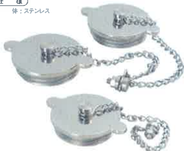
差込式差口キャップ鎖付き